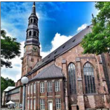
Szent Katalin templom Hamburg

Heinrich Scheidemann (1595-1663) német zeneszerző, orgonista 1611-1614 között J. P. Sweelinck-nél tanult Amsterdamban. Korábbi zenei képzését apjától kaphatta, aki Wöhrdenben és Hamburgban volt orgonista. 1629-től Heinrich Scheidemann lett a hamburgi Szent Katalin Templom orgonistája, amely állást harminc éven át, haláláig töltötte be. Orgonaművei, amelyek a kortárs zeneszerzőkhöz képest viszonylag nagy számban maradtak fenn, széles körben ismertek voltak a kortársak körében. Míg Praetorius, Schütz, Scheidt és Schein a kor minden műfajában alkottak, addig Scheidemann szinte csak orgonazenét írt, leszámítva néhány dalt és csembalódarabot.